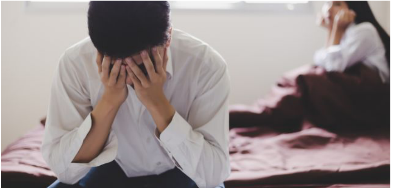
泌尿百科 | 早洩影響伴侶關係打擊自信 先天與後天性早洩治療方法不同宜及早求醫