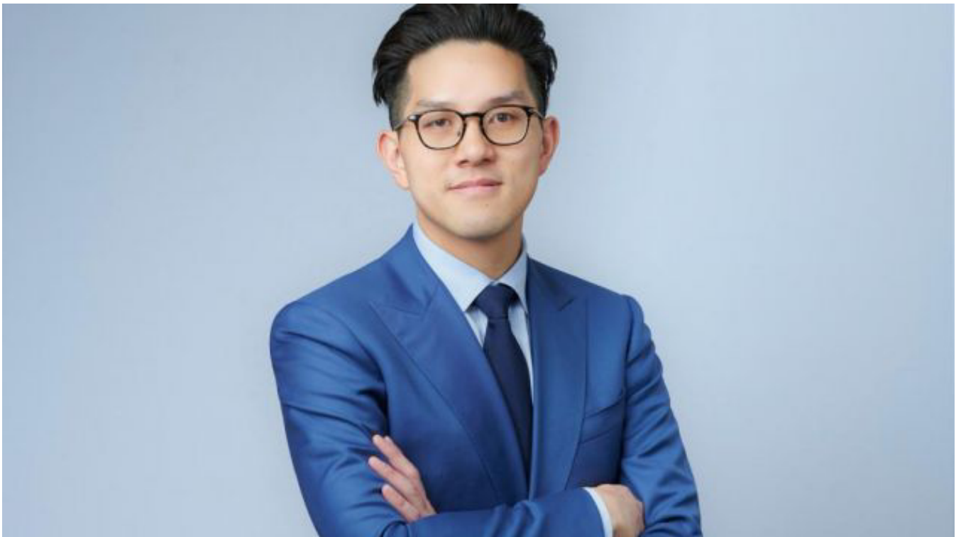
心房顫動 | 房顫患者中風風險高五成 微創左心耳封堵術助病人預防缺血性中風