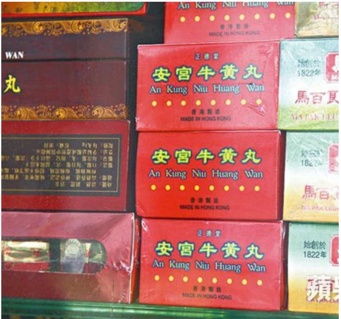
市面上雖同稱為安宮牛黃丸，但配方其實各有不同。